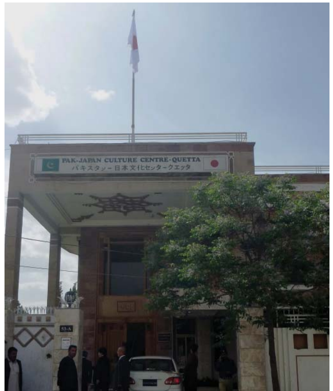
Office of the Honorary Consul-General of Japan at Quetta.